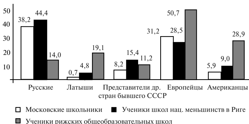
Рисунок 1. Распределение ответов старшеклассников Москвы и Риги на вопрос о том, представители каких национальностей могли бы стать их близкими друзьями

ет выделить ряд характерных моментов (таблица 2).