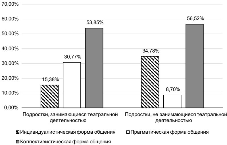
Рисунок Гистограмма распределения подростков по предпочитаемым формам общения со сверстниками для контрастных групп