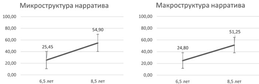
Рис. 1. Развитие интегральных показателей микро- и макроструктуры нарратива у детей в возрасте 6,5–8,5 года